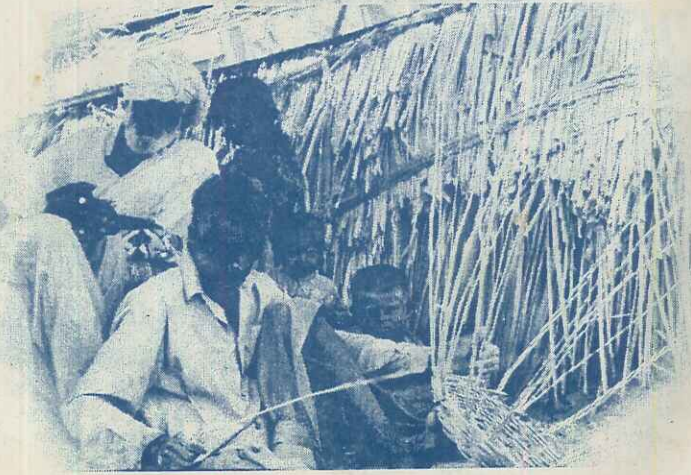
سرا نیکی لوک سانجھ