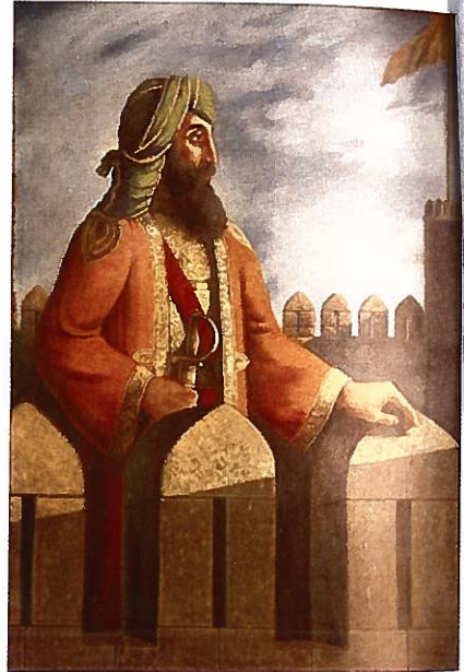
مول راج دا ہک پورٹریٹ

(اے برٹش پینٹنگ انٹرنیٹ کنس گیدھیاں گھین)