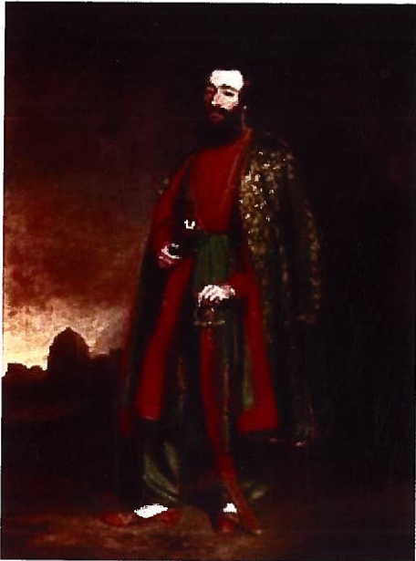
انگریز افسر میجر ایڈورڈ ہربرٹ