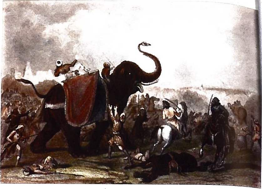
مول راج تے انگریزی فوج دی پیلیھی بھڑاند