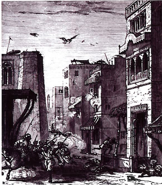
ملتان شاہرتے چڑھائی (اے برٹش پیپٹنگو انٹرنیٹ کینس گیدھیاں گئیں)